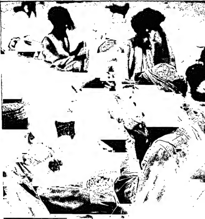
मायावर गुज्जर प्रवास में